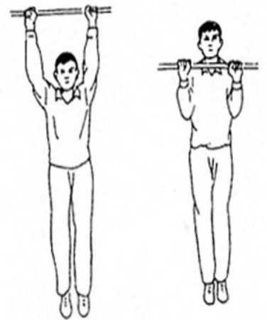
图 1 引体向上动作示意图